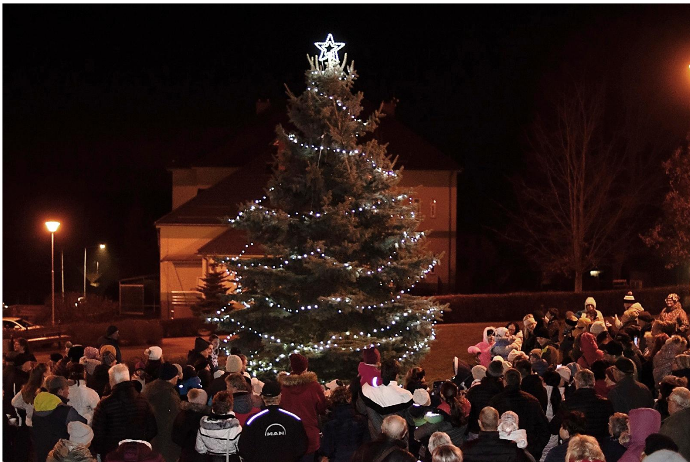
Rozsvěcení vánočního stromu.