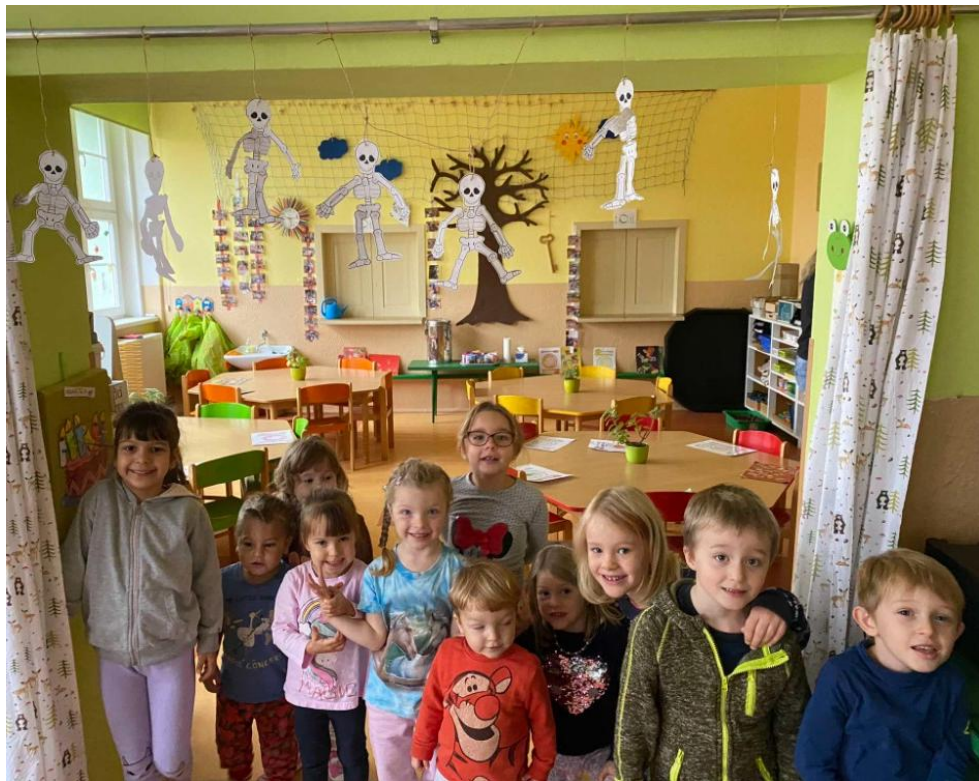
Svátek Halloween.

Zakusili jsme sílu větru při pouštění draků v přírodě a intenzitu našeho dechu při foukání do perliček a